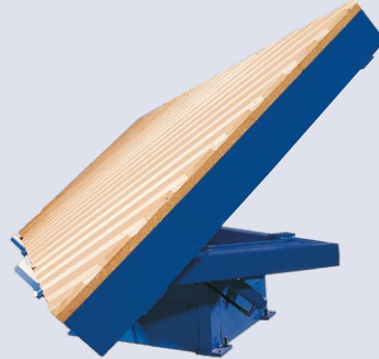
Kipptisch und/oder hydraulische Rollen (optional)