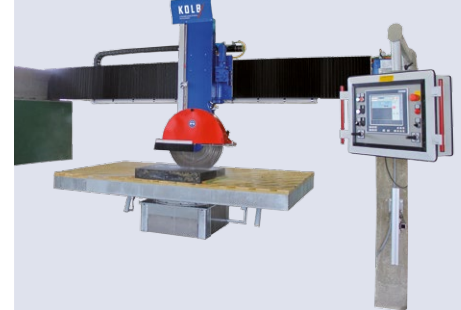
Automatische Tischdrehung 0 - 360° (optional)